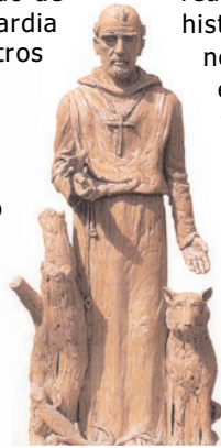
San Francisco de Asís. Conservatorio de Monzón (Huesca)

En principio, seguir trabajando, experimentando y sobre todo quiero tratar de continuar dando a conocer la obra de Antonio Oteiza que tanto admiro. Poco a poco he ido descubriendo que lo interesante es ver que detrás de una obra cerámica hay un artista con unos sentimientos, unos posicionamientos frente a la naturaleza, frente a la ecología, frente a la religión o frente a la civilización en sí. Y que cuando se