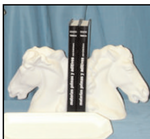
Hemos ampliado nuestro catálogo de piezas realizadas con bizcocho cerámico. Disponible en nuestra web.