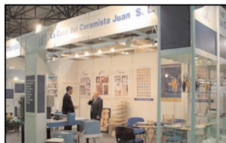
Estuvimos en Cevisama presentando numerosas novedades