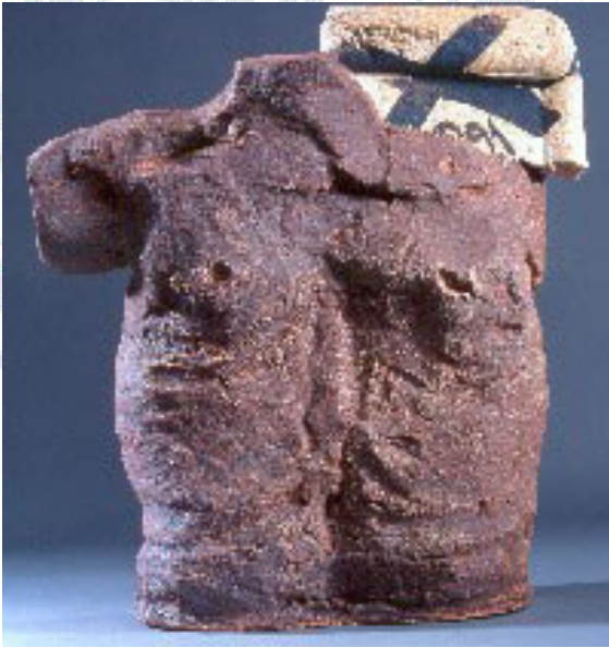
La exposición puede visitarse en el Museo nacional Centro de Arte Sofía hasta mediados de enero

Con esta exposición se conmemora el galardón "Premio Velázquez de las artes plásticas" que le fue otorgado al artista Antoni Tàpies en 2003.