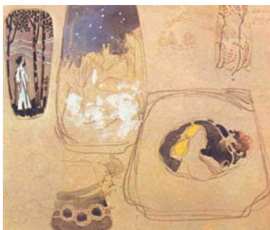
Imágenes de su obra