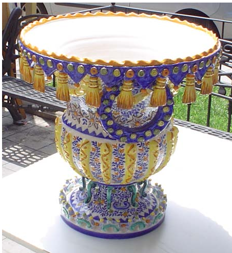
Cerámica de Manises