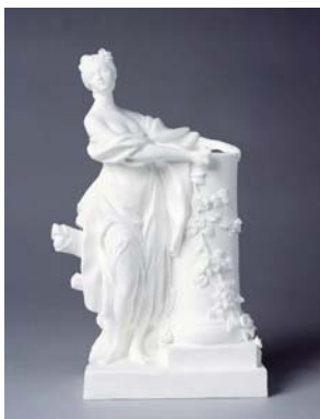
Obra de Etienne-Maurice Falconet, 1755. Porcelana tierna en bizcocho.

La muestra podrá verse hasta finales de abril